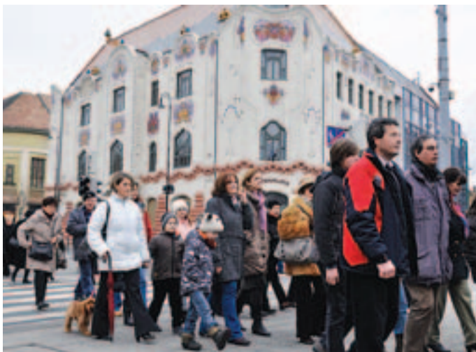
Adókedvezmény a gyerekek után. A házasság hete rendezvényen sok gyermekes család vonult fel

A szakember egyebek mellett elmondta, hogy a személyi jövedelemadó fizetése tekintetében, ha valaki 183 napnál rövidebb ideig dolgozik külföldön kiküldetésben, akkor a belföldi jogszabályok szerint adózik. Amennyiben a munkavállalás a fentebb említett időszakot meghaladja, akkor külföldön keletkezik adókötelezettség. Akkor, ha a munka 183 napnál hosszabbra tervezett, de a félévet valami oknál fogva nem éri el, belföldi adókötelezettség keletkezik.