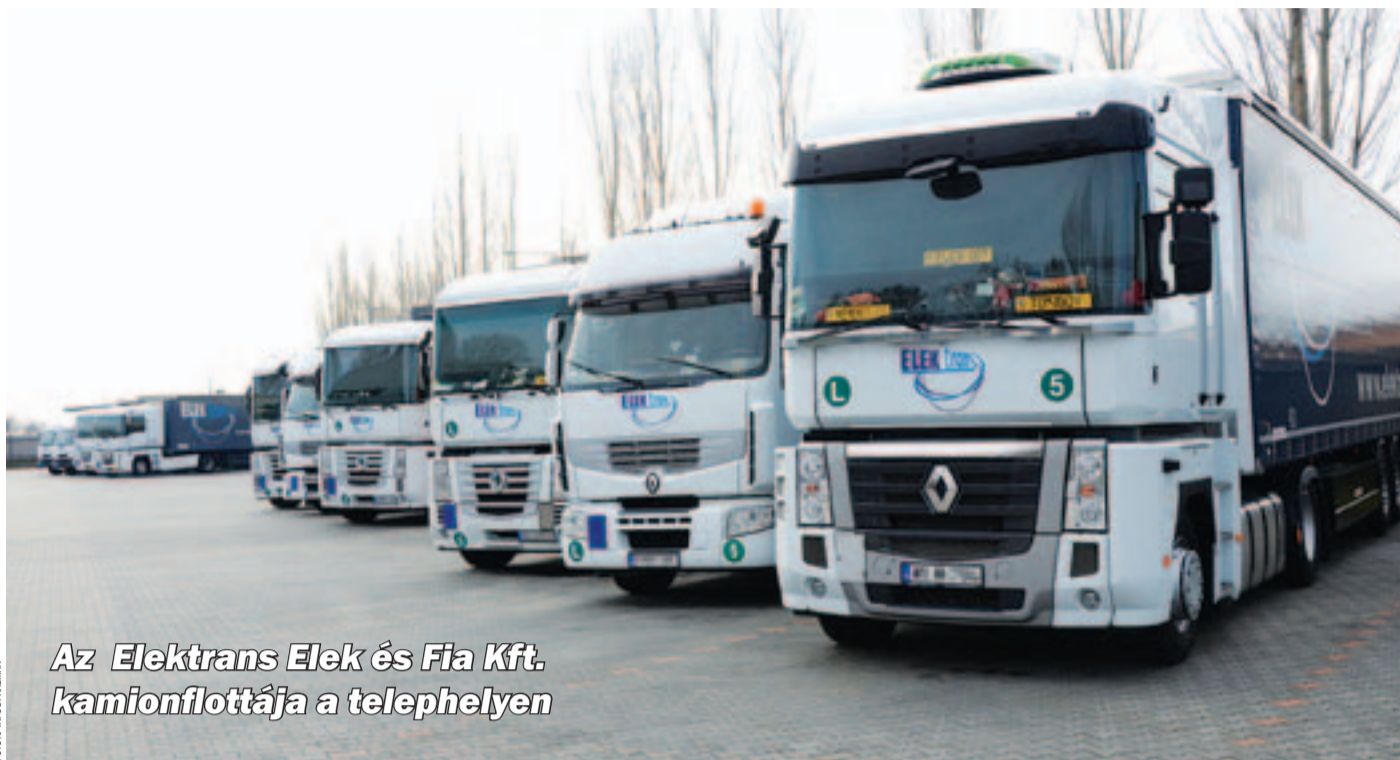
Az Elektrans Elek és Fia Kft. kamionflottája a telephelyen

KISKUNHALAS A betelepülőket kedvezményekkel is segíthetik