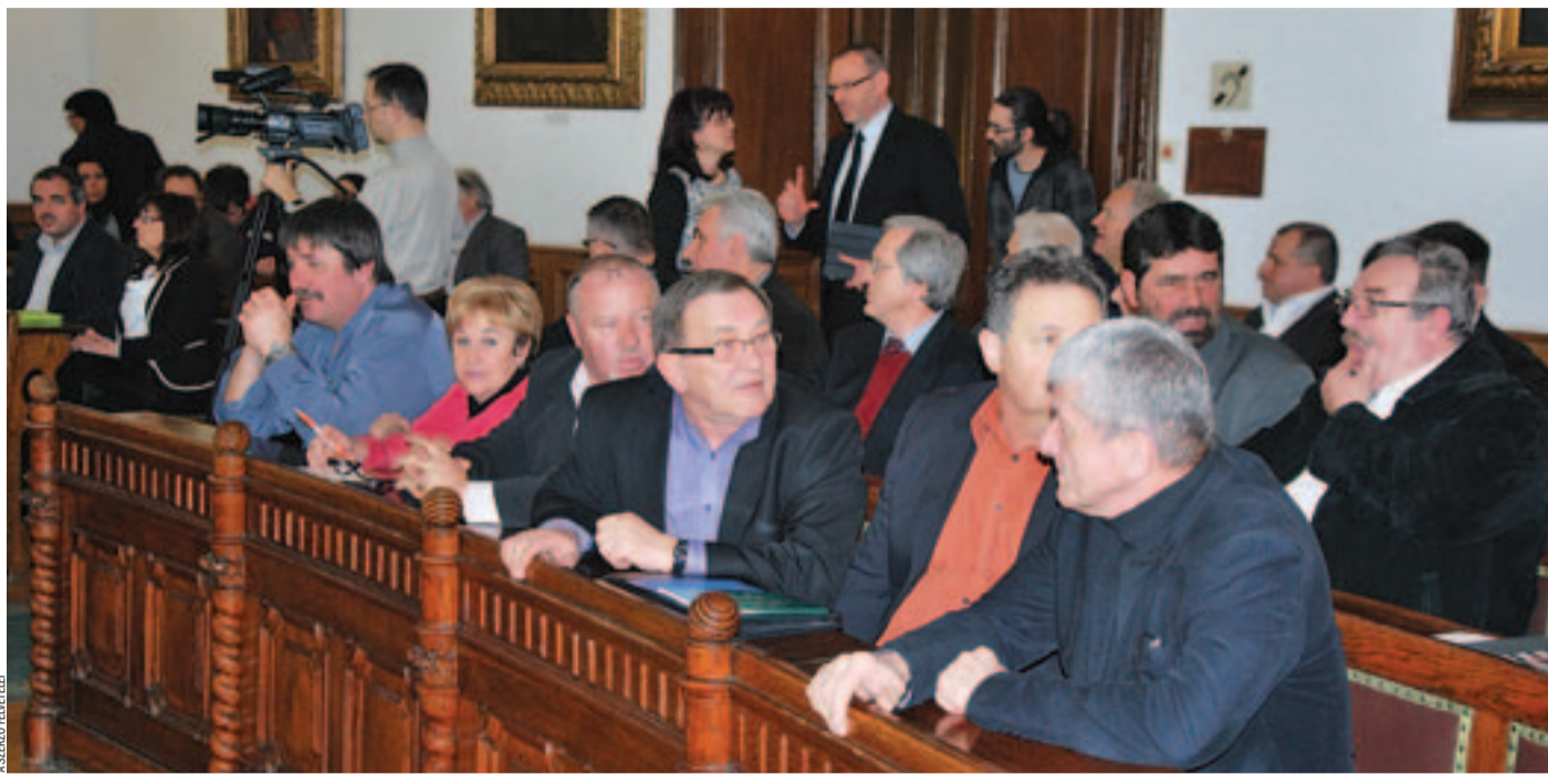
A bajai városháza dísztermében nyitották meg a gazdasági évet mintegy hatvan vállalkozó előtt

ÉVNYITÓ Kamarai rendezvény a bajai városházán